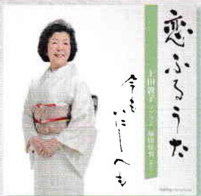
販売元:株式会社フォンテック ¥2,700(税別) FOCD20122

96年上毛芸術奨励賞、及び99年に設立の歌曲伴奏者に対する賞『水谷達夫賞』の第一回受賞者。日本演奏連盟所属。