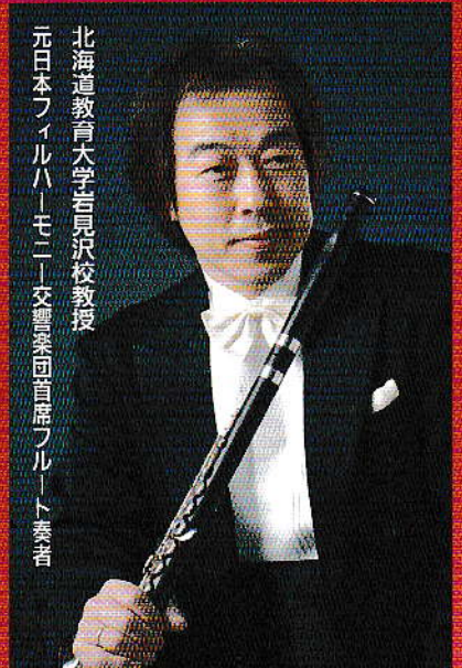
北海道教育大学岩見沢校教授 元日本フィルハーモニー交響楽団首席フルート奏者